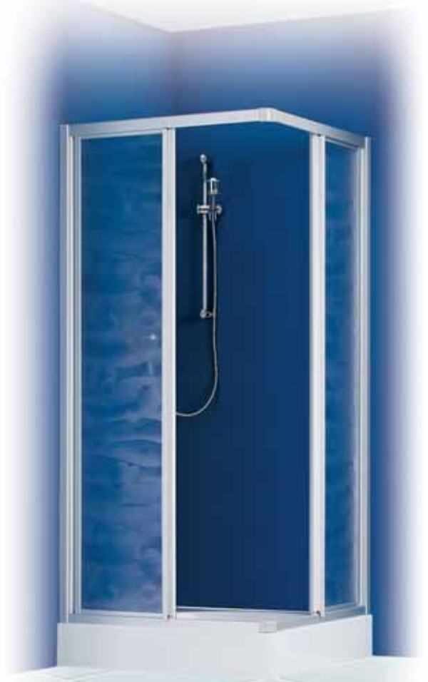
Eck-Schiebetür - geöffnet