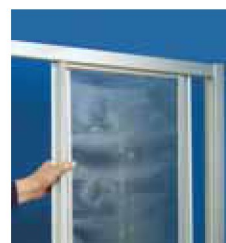
Hintere Türsegmente bei Eckschiebetüren lassen sich zur Pflege vorziehen und abschwenken.