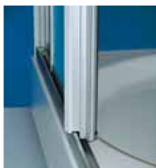
Entriegelung der Türsegmente durch Hochschieben der Griffleisten.