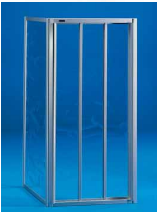
Schiebetür 3-teilig mit Seitenwand Kunststoffscheiben, alternativ mit Echtglas

Zum Abdichten gegen Spritzwasser sind die Schiebetüren an den Rahmenseiten mit einem speziellen Dichtsystem ausgestattet, bei Ecktüren sorgt der weich gelagerte, durchgehende Magnetverschluss für eine sichere Abdichtung und leises Schließen.