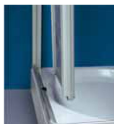
Türsegmente von Schiebe- und Eckschiebetüren können zur leichten Pflege nach innen geschwenkt werden.