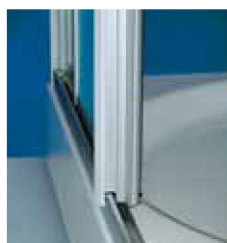
Untere Türführung mit glattem Laufprofil.