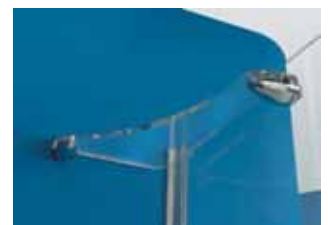
Konsole zur Seitenwandbefestigung und Abstellmöglichkeit für Badeutensilien.