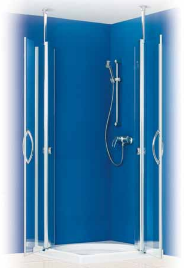
EckEinstieg - Pendeltür (geöffnet)