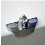
Wannenkonsole , für alle Wannen geeignet.