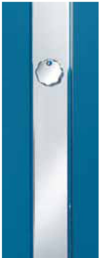
Funktions-Drehsäule mit Drehgriff für Waterstop-Liftsystem WLS.