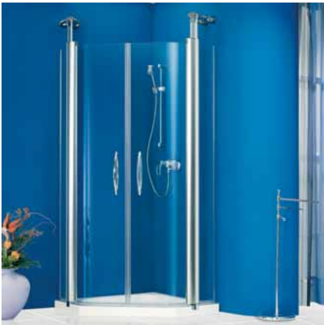
Fünfeckdusche - Pendeltür Zwei Flügel, Funktions-Drehsäulen mit Wandkonsolen.

Die ästhetische Formgebung gibt Ihrem Bad ein besonderes Ambiente. Der stabile Türgriff verbindet Optik und Funktion auf anspruchsvollem Niveau. Mit der eingepassten Funktions-Drehsäule entfallen störende Beschläge/Scharniere und ermöglichen eine leichte Pflege. Durch die integrierte Anhebe-Senktechnik lassen sich die Türflügel beim Öffnen und Schließen arretieren. Alle Funktions-Drehsäulen sind mit Teleskop-Deckenstützen ausgestattet, montierbar bis 2600 mm Höhe. Bei Montage zur Wandseite stehen speziell geformte Wandkonsolen zur Verfügung. Auf Wunsch kann die Anordnung der Funktionsdrehsäule geändert werden.