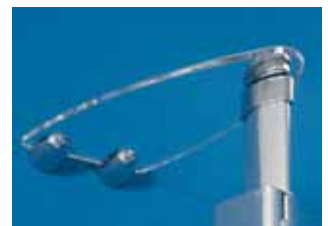
Konsole für Teleskop-Deckenstütze zur Wandbefestigung.

Anordnung der Funktions-Drehsäule kann bei geraden Türen auf Wunsch nach räumlicher Gegebenheit geändert werden.