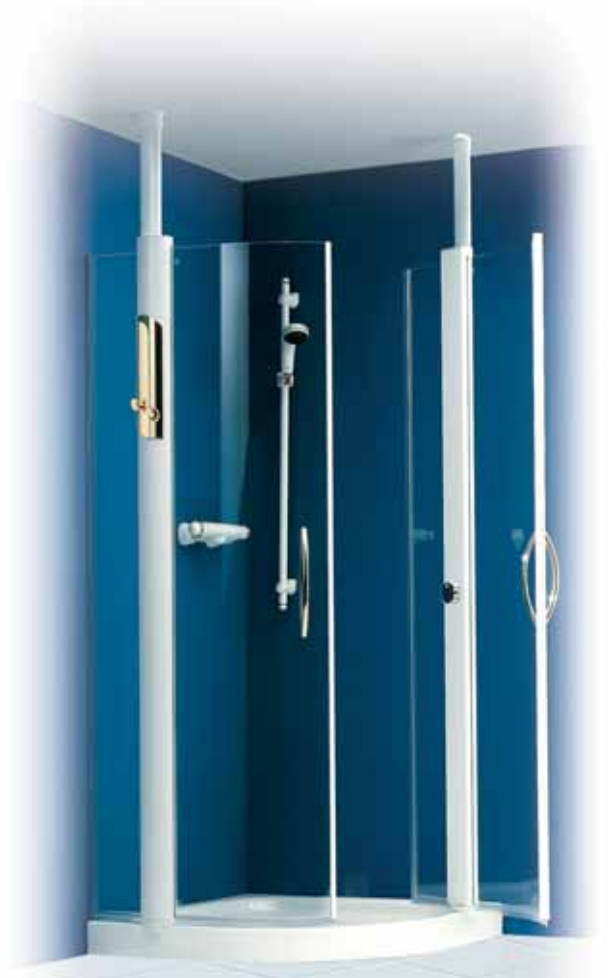
Viertelkreisdusche - Pendeltür mit Waterstop-Liftsystem WLS - (rechter Flügel geöffnet)