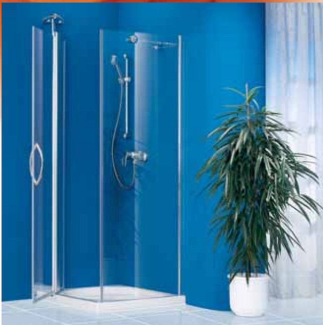
Pendeltür (geöffnet) mit Seitenwand Ein Flügel, Funktions-Drehsäule mit Wandkonsole und Seitenwand.

Die Montage wird durch integrierte Verstellmöglichkeiten bis 46 mm je nach Türart sehr vereinfacht. Teure und komplizierte Sonderanfertigungen sind deshalb nur selten erforderlich.