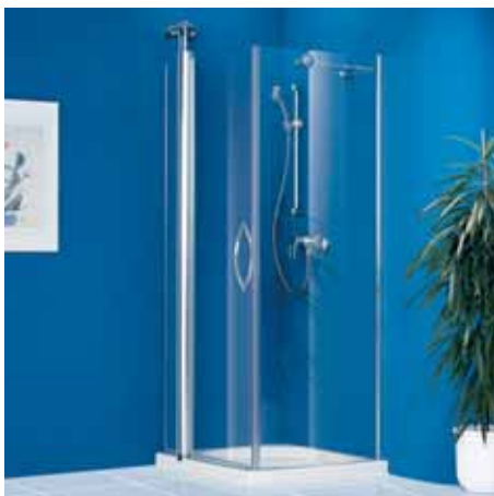
Pendeltür mit Seitenwand Ein Flügel, Funktions-Drehsäule mit Wandkonsole und Seitenwand.