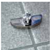
Bodenkonsole Befestigung auf Fliesen.