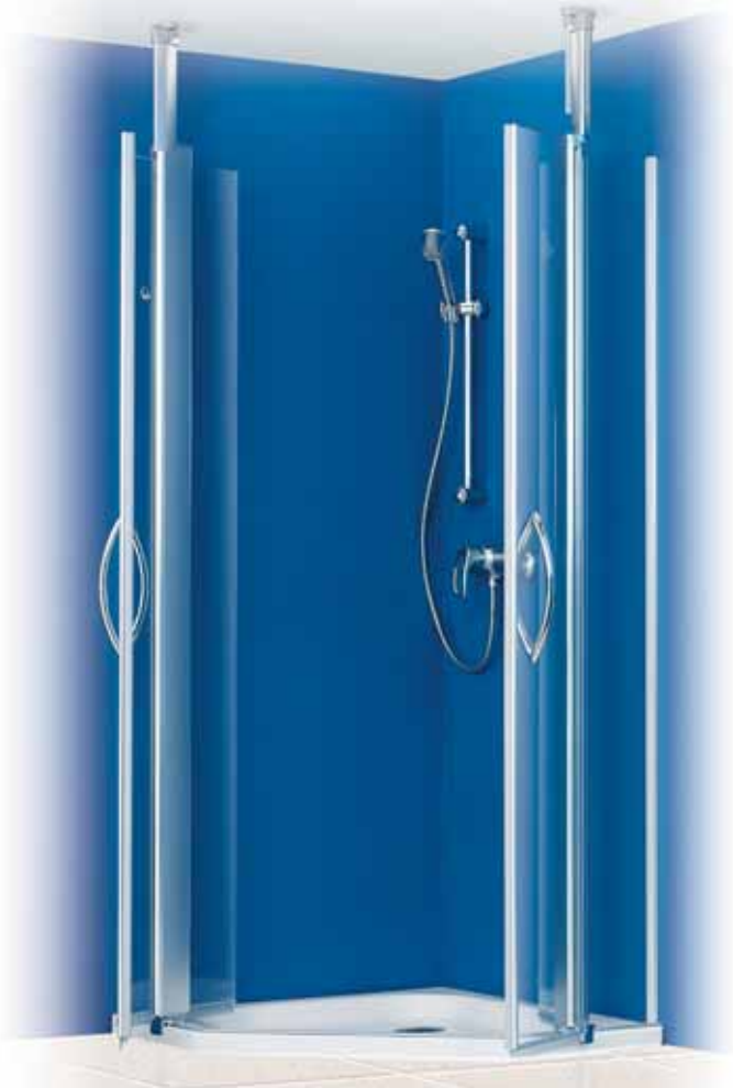
Fünfeckdusche - Pendeltür (geöffnet)